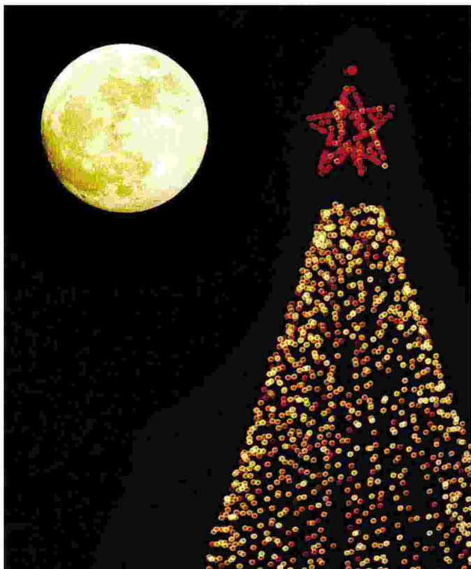
Luna piena sullo sfondo di un albero di Natale a Reno, Nevada (Usa) DAVID B. PARKER